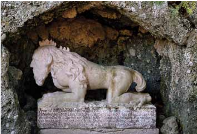
Abb. 1: Der „Forstteufel“ – Neben dem genauen Abbilden der Welt (Tiere, Pflanzen) wurden auch „Monstren“ gesammelt. So wurde um ca. 1700 im Garten die Marmorstatue eines „Forstteufels“ aufgestellt. Sie zeigt ein Wesen mit Menschkopf, Hahnenkamm, Pranken, Vogelklauen und buschigem Schwanz. Das Wesen sollte einst am Haunsberg (Flachgau) gelebt haben.