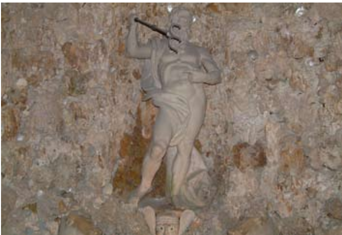
Abb. 2: Neptun – Hellbrunn ist mit antiken Götterfiguren bestückt. Hier z. B. der Meeresherr Neptun. Die römisch-griechische Götterwelt und ihre Geschichten sind typische Themen in der Literatur und Kunst der Renaissance.