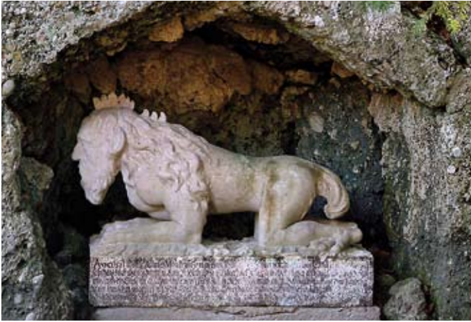
Abb. 1: Der „Forstteufel“ – Neben dem genauen Abbilden der Welt (Tiere, Pflanzen) wurden auch „Monstren“ gesammelt. So wurde um ca. 1700 im Garten die Marmorstatue eines „Forstteufels“ aufgestellt. Sie zeigt ein Wesen mit Menschkopf, Hahnenkamm, Pranken, Vogelklauen und buschigem Schwanz. Das Wesen sollte einst am Haunsberg (Flachgau) gelebt haben.