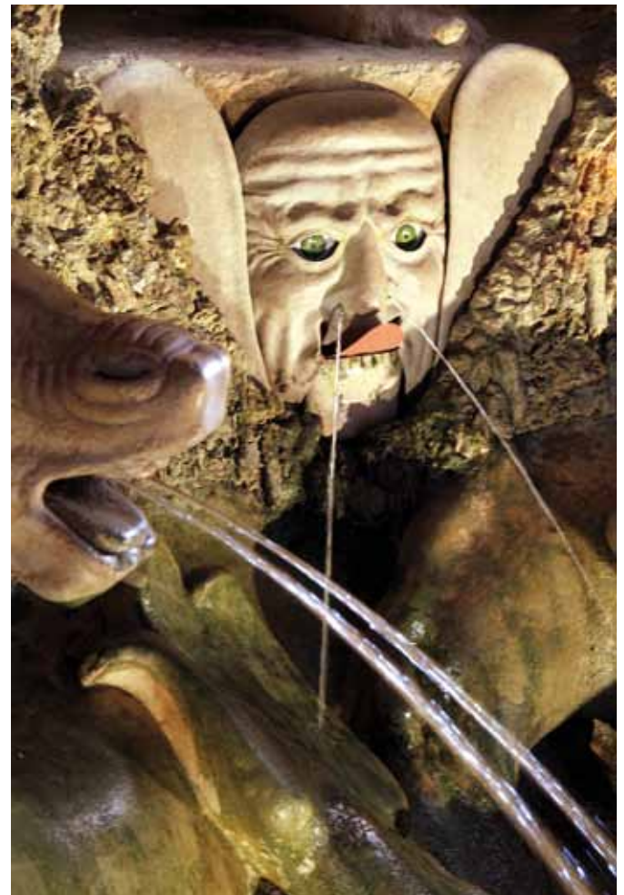
Abb. 3: Wasserautomat

Die Faszination der Errungenschaften der Technik spiegelt sich in den Wasserautomaten wider, die in Grotten präsentiert werden. Hier Abbildungen zur Erklärung, wie das Hellbrunner „Germaul“ funktioniert.