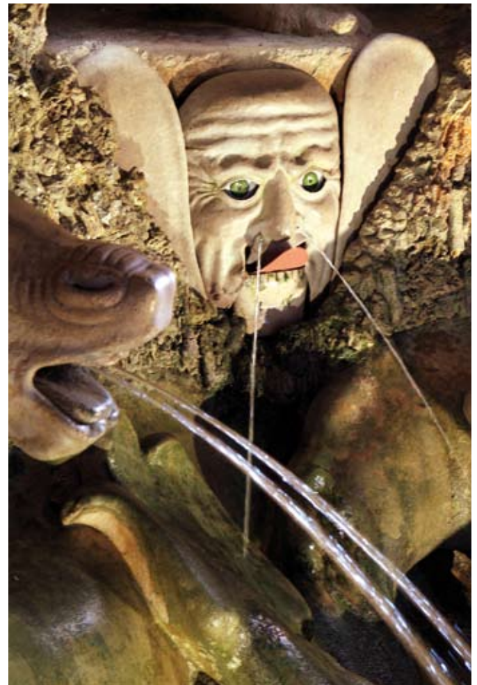
Abb. 3: Wasserautomat

Die Faszination der Errungenschaften der Technik spiegelt sich in den Wasserautomaten wider, die in Grotten präsentiert werden. Hier Abbildungen zur Erklärung, wie das Hellbrunner „Germaul“ funktioniert.