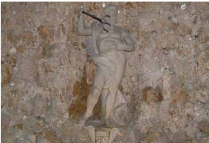
Abb. 2: Neptun – Hellbrunn ist mit antiken Götterfiguren bestückt. Hier z. B. der Meeresherr Neptun. Die römisch-griechische Götterwelt und ihre Geschichten sind typische Themen in der Literatur und Kunst der Renaissance.